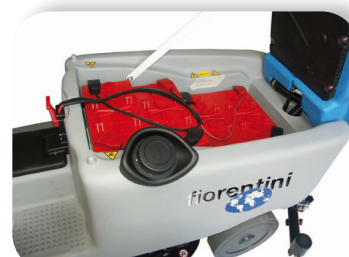
batterie al gel o acido con grande autonomia

Lead acid or gel batteries with great autonomy