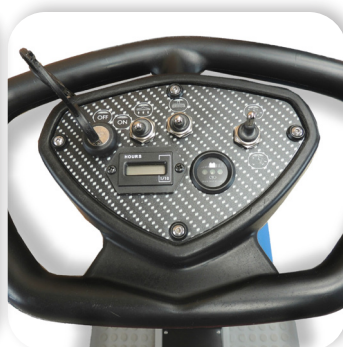
comandi semplici e intuitivi

Lead acid or gel batteries with great autonomy