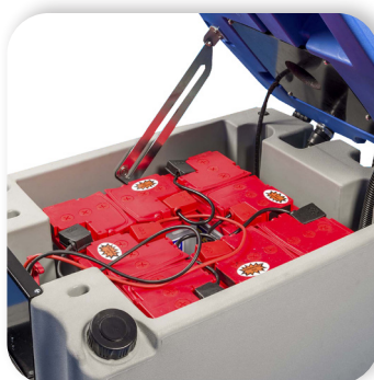
batterie al gel o acido con grande autonomia

Lead acid or gel batteries with great autonomy