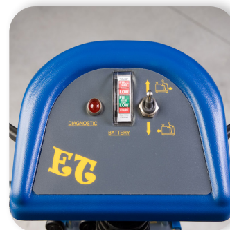
comandi semplici e intuitivi simple and intuitive controls