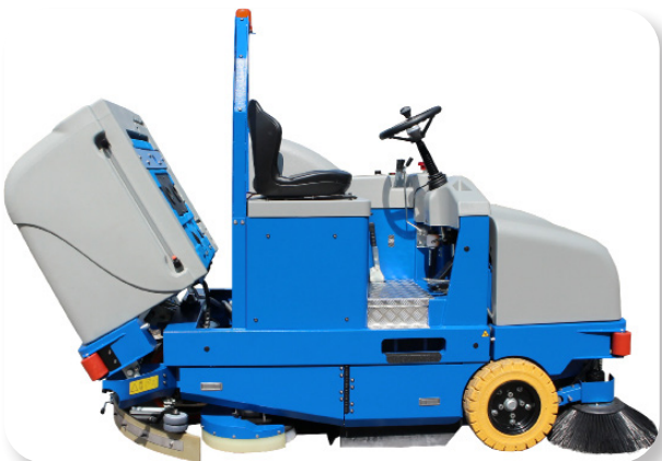
facile accesso per eventuale manutenzione