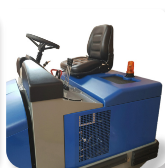
controlli semplici ed intuitivi user-friendly controls