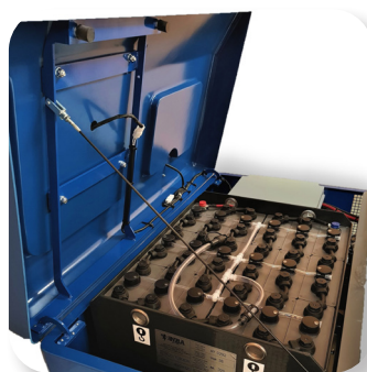
manutenzione molto facile easy maintenance