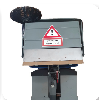
scarico alto per facilitare il lavoro dumping height