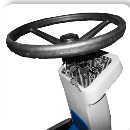
comandi semplici e intuitivi simple and intuitive controls