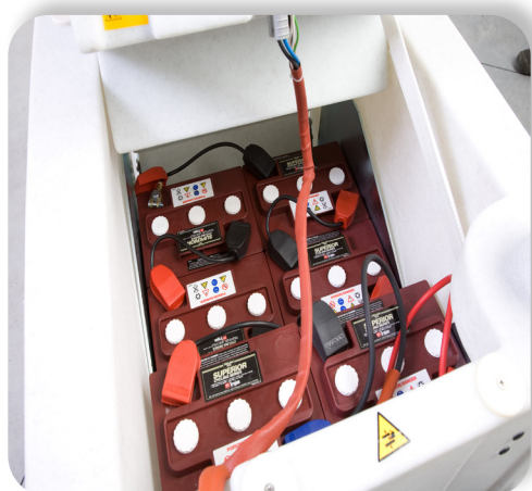
batterie al gel o acido con grande autonomia Lead acid or gel batteries with great autonomy